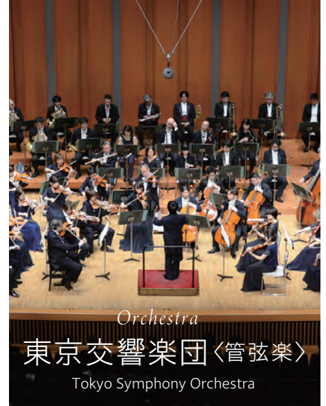
Orchestra 東京交響楽団〈管弦楽〉 Tokyo Symphony Orchestra

1946年創立。文部大臣賞、毎日芸術賞、サントリー音楽賞、文化庁芸術作品賞、川崎市文化賞等を受賞。文化庁の助成を受け、サントリーホール、ミュンヘン・ザクセン・シムフォニーホール、東京オペラシティコンサートホールで主催公演を行う。また、川崎市、新潟市と提携し、演奏会やアウトリーチを積極的に展開している。「こども定期演奏会」「0歳からのオーケストラ」等教育プログラムも注目されている。新国立劇場のレギュラーオーケストラとして毎年オペラ・バレエ公演を担当。海外公演も多く、ウィーン楽友協会をはじめ、これまで58都市で、国際交流の実を挙げている。さらに音楽・動画配信サービス『TSO MUSIC&VIDEO SUBSCRIPTION』をスタートするなどITへの取組みでもリードしている。