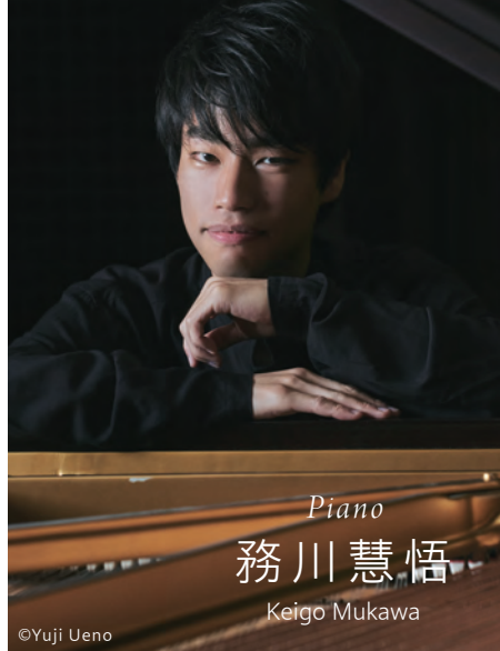
Piano 務川慧悟 Keigo Mukawa

2019年ロン＝ティボー＝クレスパン国際コンクールにて第2位入賞。2021年エリザベート王位国際コンクール第3位入賞など数々の国際コンクールで入賞を果たす実力派ピアニスト。2012年、第81回日本音楽コンクール第1位受賞を機に本格的な演奏活動を始める。2014年パリ国立高等音楽院に審査員満場一致の首席で合格し渡仏。同音楽院第2課程ピアノ科、室内楽科を修了し、第3課程ピアノ科、フォルテピアノ科に在籍。現在は、日本やヨーロッパ各地で演奏会を開催している。また、テレビやラジオへの出演、雑誌のコラムを連載するなど多方面で活動している。CDは反田恭平とのピアノ・デュオ『Two Pianos』(NOVA Record)、ソロ・デビュー『ショパン|ラフマニフ|プーレーズ』(ALM Record)をリリースしている。また、自身の編曲によるラヴェル『マ・メール・ロワ』ピアノソロ版の譜面を Muse Press より出版している。